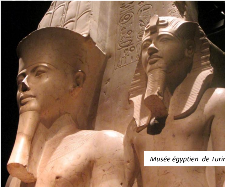
Musée égyptien de Turin - Galerie Sabaude