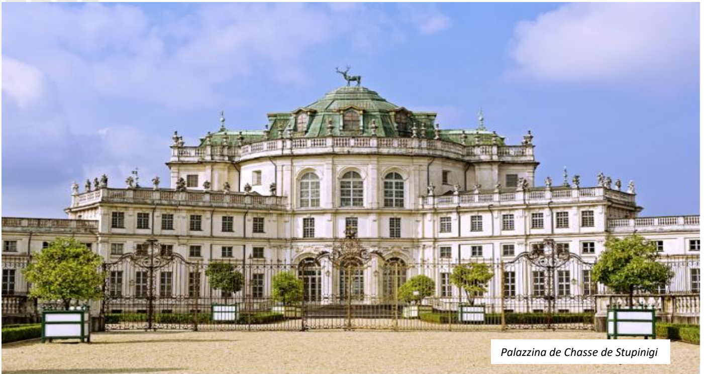
Palazzina de Chasse de Stupinigi