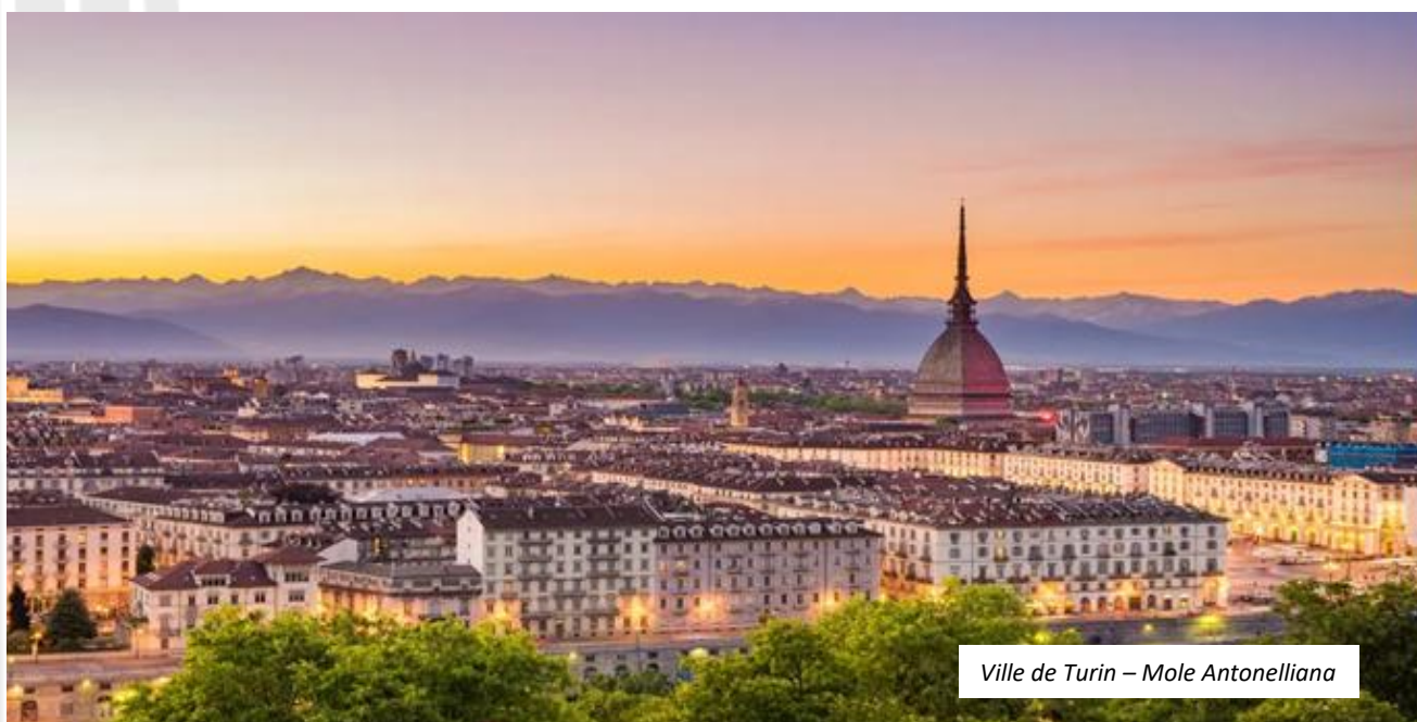
Ville de Turin – Mole Antonelliana

28 avril 2026 Vol direct Milan Bergamo 11:10 / Toulouse 12:45 (Ryanair)