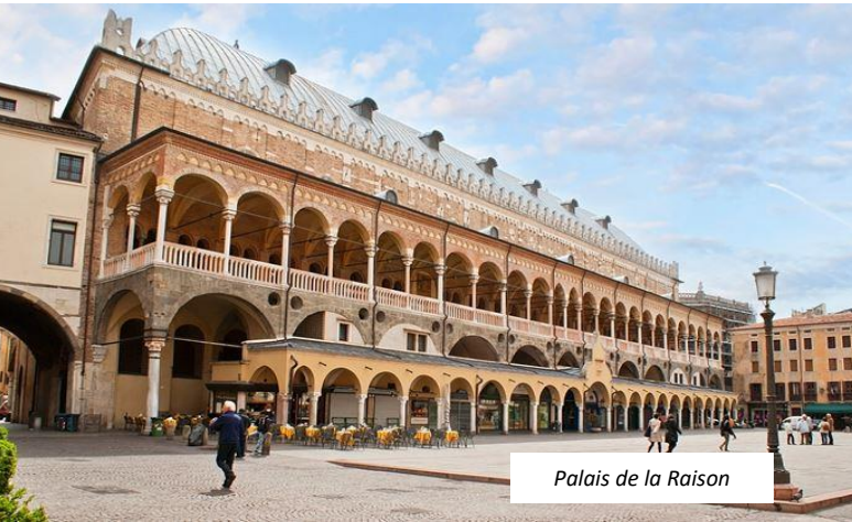
Palais de la Raison