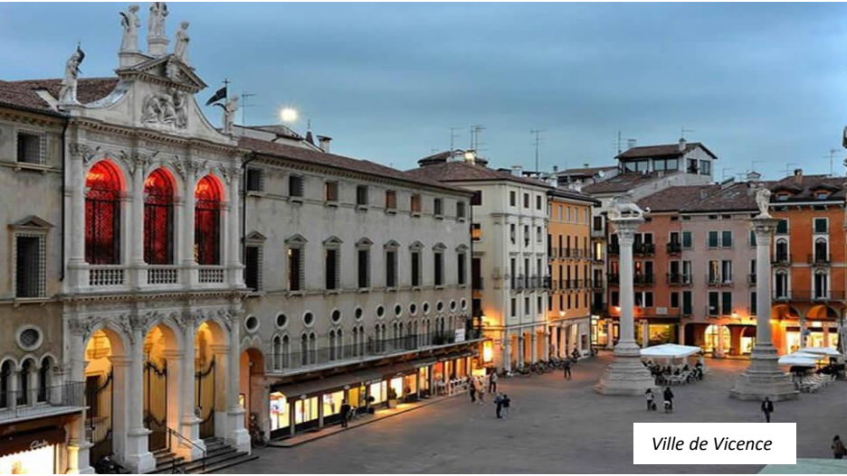
Ville de Vicence

23 Mai 2024 Vol direct Trévise 20:55 / Toulouse 22:40 (Ryanair)