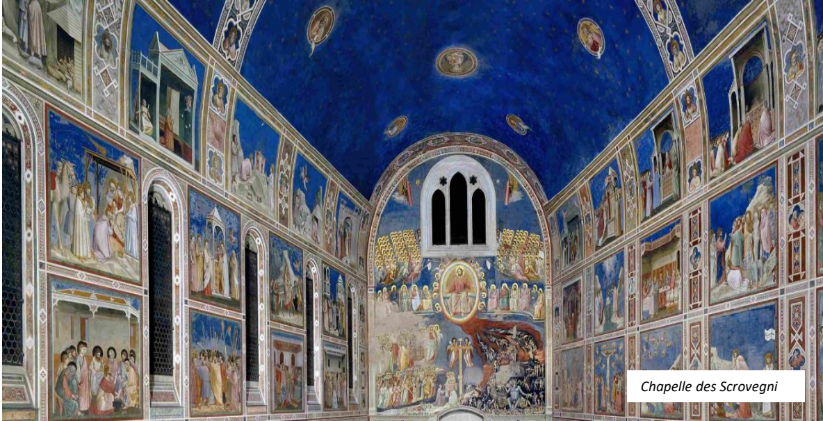
Chapelle des Scrovegni