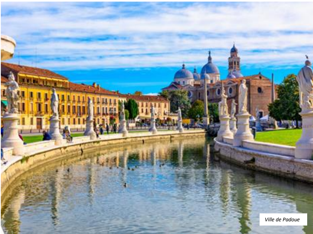
Ville de Padoue