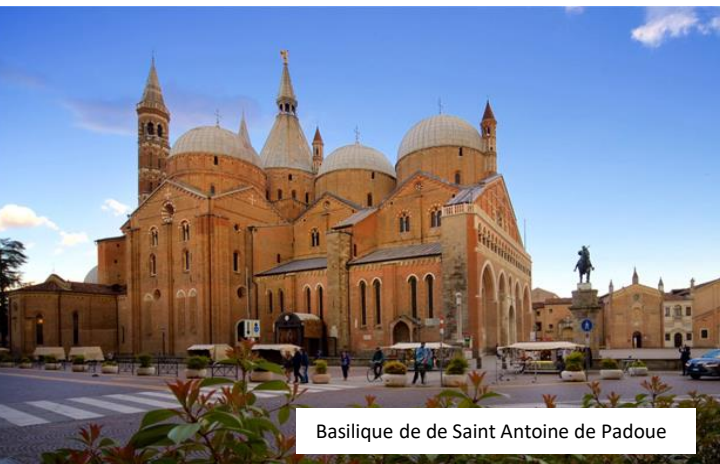
Basilique de de Saint Antoine de Padoue